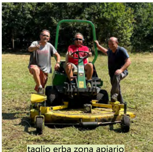
taglio erba zona apiario