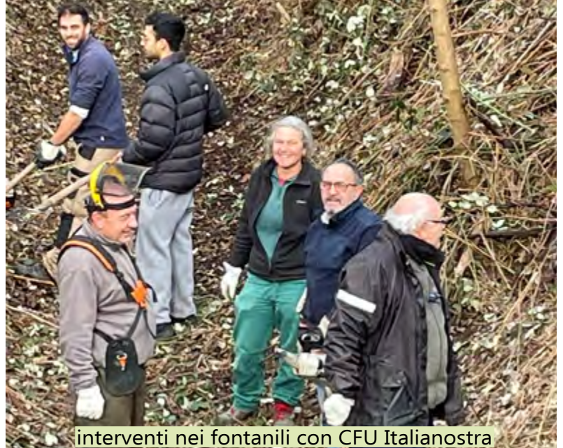
interventi nei fontanili con CFU Italianostra