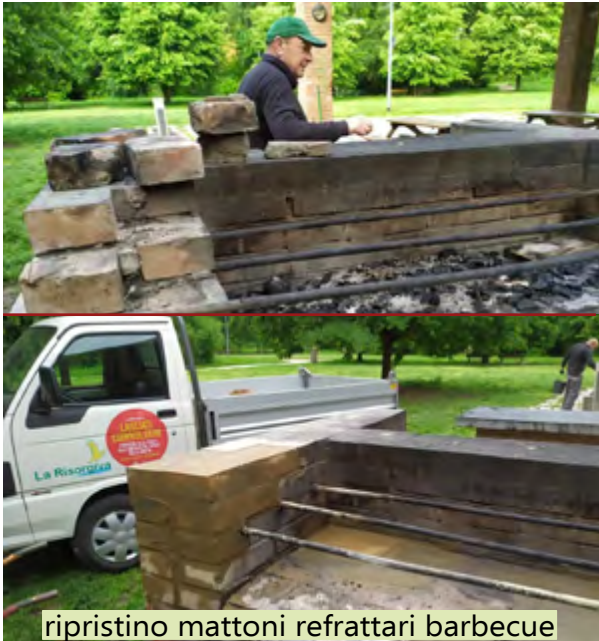
ripristino mattoni refrattari barbecue

Come ben sapete il gruppo manutenzione, per almeno due giornate alla settimana, si dedica ai numerosi interventi all'interno del bosco. Qui sotto potete vedere alcune immagini che fotografano sia l'attività che i momenti di convivialità, essenziali a rafforzare la squadra e a rendere meno pesante (perchè la fatica a volte si fa sentire!) il lavoro.