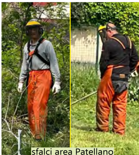
sfalci area Patellano