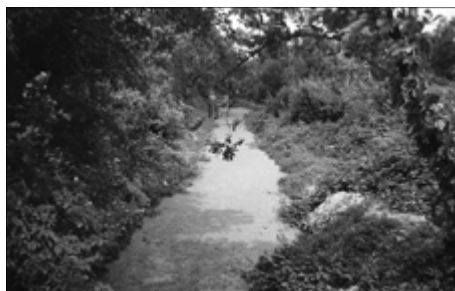
Il fontanile dei Frati

DOMENICA 17 OTTOBRE AL BOSCO DELLA GIRETTA FESTA D'AUTUNNO