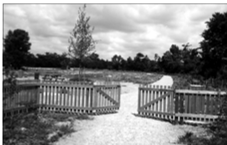
Ingresso di v. Silone

Sabato 9 ottobre 2004: inaugurazione a Seguro del primo ampliamento del Bosco della Giretta. Nel prossimo numero del giornale (dicembre 2004), daremo un ampio resoconto di questo importante avvenimento.