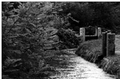
Le chiuse al Bosco della Giretta (R. Poggi)